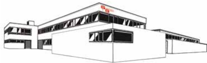
WERK 1 Verwaltung + Rollenverarbeitung

Ihren Wünschen und Vorstellungen werden nur durch die physikalischen Bedingungen Grenzen gesetzt. Wir bringen aber ihre Ideen nach tiefziehtechnischen Möglichkeiten in die gewünschte Form.